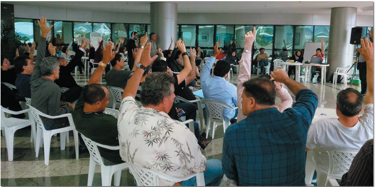
Assembleia Geral, na última sexta-feira (25), no prédio da JF.

A Assessoria Jurídica do SIN-TRAJUSC impetrou Mandado de Segurança contra o ato do Conselheiro Fabiano Silveira, integrante do CNJ, intervindo na greve dos servidores do Poder Judiciário Federal.